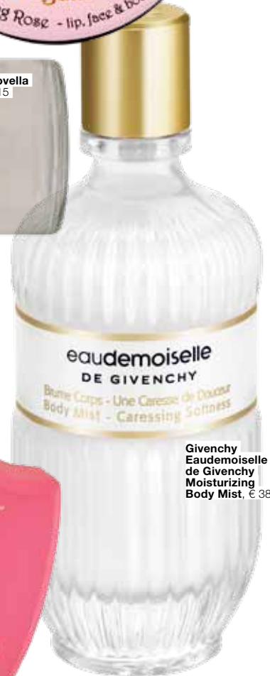
Givenchy Eaudemoiselle de Givenchy Moisturizing Body Mist, € 38,50