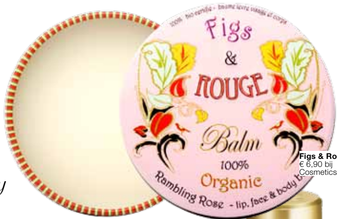
Figs & Rouge balm, € 6,90 bij Cosmeticsandcare.nl

Beautyredacteur Jessica Godfrey verzamelt deze maand vintage-ogende verpakkingen.