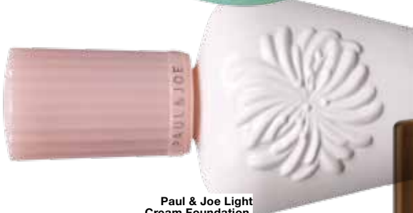
Paul & Joe Light Cream Foundation, € 36,74 bij Asos.com