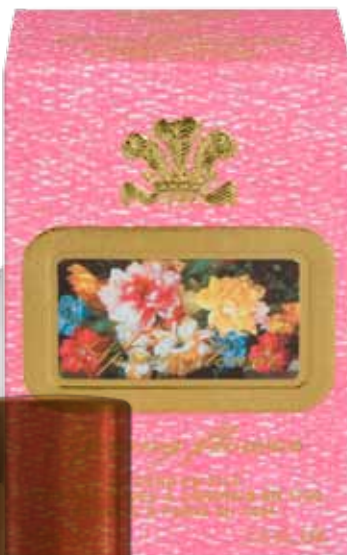
Creed Spring Flower parfum, € 80 bij Skins.nl