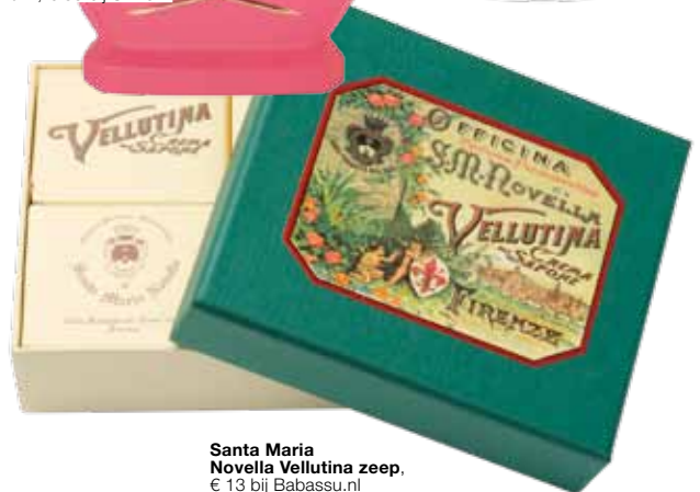
Santa Maria Novella Vellutina zeep, € 13 bij Babassu.nl