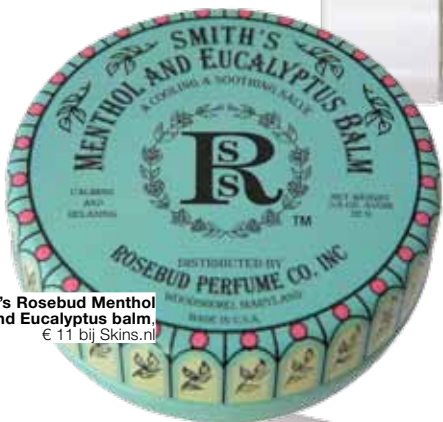
Smith's Rosebud Menthol and Eucalyptus balm, € 11 bij Skins.nl